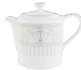
Théière Teapot 55 cl - 18.5 oz H : 13,5 cm - 5.3" Réf. 31370 450 0410