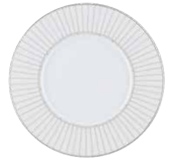
Assiette creuse à aile Rim soup plate Ø 28,5 cm - 11.2" Réf. 31370 354 0130