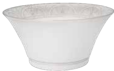
Saladier Salad bowl 200 cl - 67.6" Ø 26 cm - 10.2" Réf. 31370 349 0053