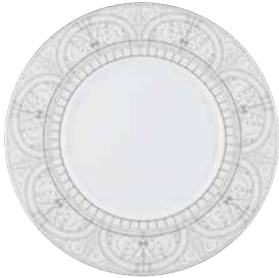
Assiette de présentation Underplate Ø 32 cm - 12.6" Réf. 31370 354 0029