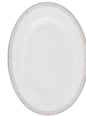
Ravier Pickle dish L : 23 cm - 9" l : 16,4 cm - 6.4" Réf. 31370 128 0065