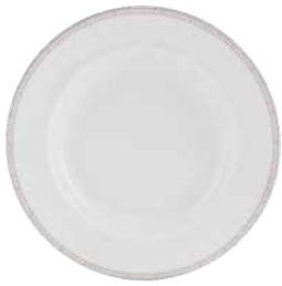
Plat rond creux Deep platter Ø 31,5 cm - 12.4" Réf. 31370 128 0035