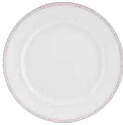
Plat rond plat Flat dish Ø 31,5 cm - 12.4" Réf. 31370 128 0031