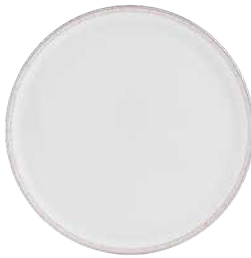
Plat à tarte Tart platter Ø 31,5 cm - 12.4" Réf. 31370 111 0071