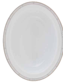
Plat ovale Oval dish 40 cm - 15.7" L : 31,5 - 12.4" Réf. 31370 301 0042