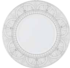
Assiette gastronomie Large dinner plate Ø 29,5 cm - 11.6" Réf. 31370 354 0022