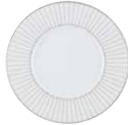
Assiette à dessert Dessert plate Ø 24,5 cm - 9.6" Réf. 31370 354 0007